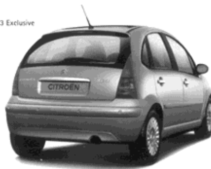
Citroën C3 Exclusive