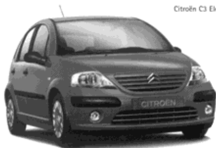
Citroën C3 Elegance